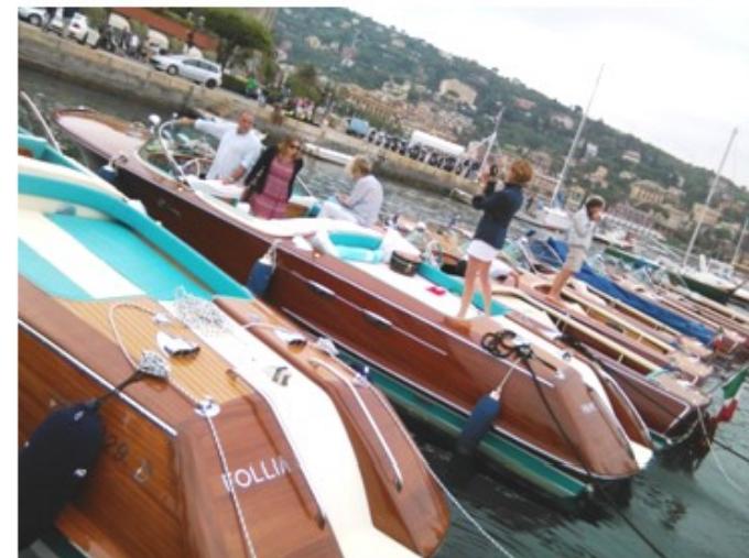
Immagini dell'edizione 2015

Le Associazioni "Riva Society Italia" e "Riva Historical Society" patrocinano anche l'edizione 2017, promuovendo la manifestazione presso i propri associati.