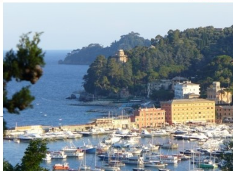
Villaggio Ospitalità: Calata del Porto