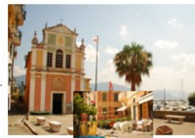
Piazzetta S. Erasmo