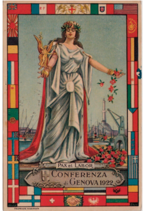
La Conferenza di Genova del 1922 in una illustrazione e una cartolina d'epoca